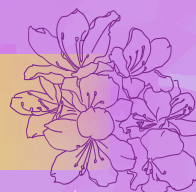
舞鶴市の花: ツツジ